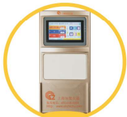
7寸真彩触摸屏 白板设计透明插页框